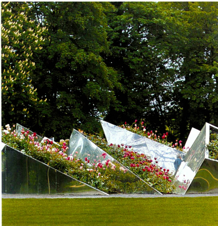
Der Rosengarten des Schlossparks Wolfsburg...

als kontemplativer Ort bestehen bleiben. Die vielfältigen Umgestaltungsmassnahmen wurden in Abstimmung mit der Gartendenkmalpflege vorgenommen. Sichtachsen konnten wieder freigelegt und der Park nach aussen hin geöffnet werden. Von den hinzugewonnenen Räumen (Allerwiesen und Pferdewiesen) eröffnen sich ungeahnte Perspektiven in den historischen Park. Die unter Naturschutz stehenden Allerwiesen wurden durch einen Holzsteg behutsam erschlossen, die Pferdewiesen durch die Gestaltung der Koppelzäune (weiss und rosa) in das Farbgebungskonzept des Parks einbezogen. Für den gesamten Park wurde der Übergang von extensiv zu intensiv genutzten Bereichen in Farben übersetzt, in einem Farbspektrum gedeckter Rottöne. Der Entwurf bewahrt alte