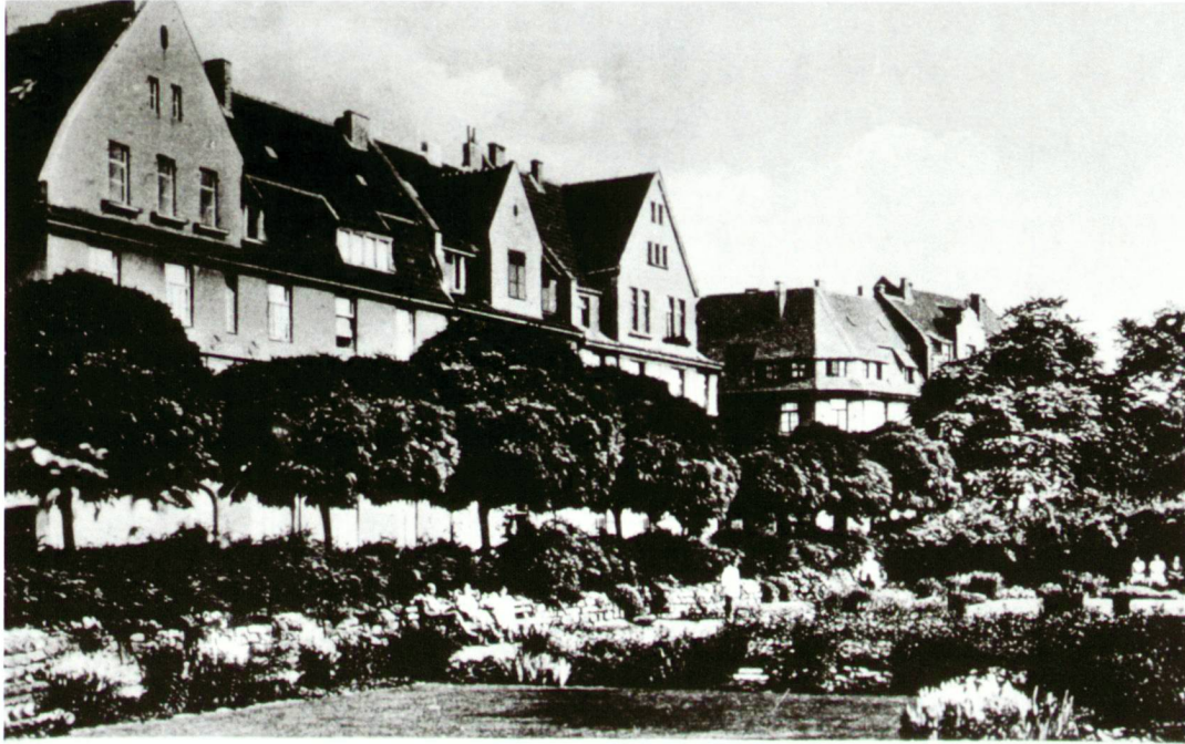
Köln-Humboldt-Kolonie, Pack an der Pülvermühle

Die Sanierung des Kölner Stadtgrüns steht zwischen gartendenkmal- pflegerischen Massnahmen und pragmatischer Problemlösung.