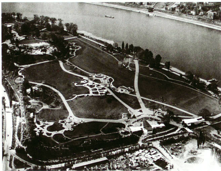
Rheinpark: Bundesgartenschau 1957.

Rheinpark: Exposition fédérale de jardins 1957.