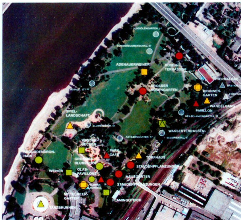
Rheinpark. Luftbild mit Eintragung des Erhaltungszustandes wesentlicher Parkelemente, Zustand 2002.