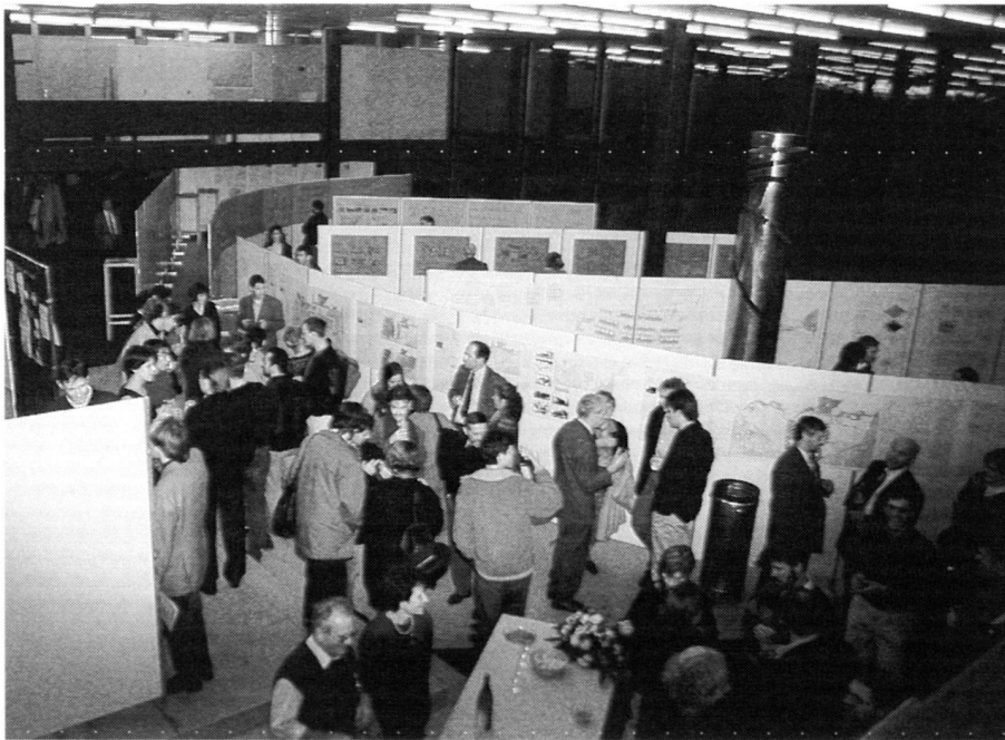
Diplomfeier 1994 – Ausstellung der Diplomarbeiten.