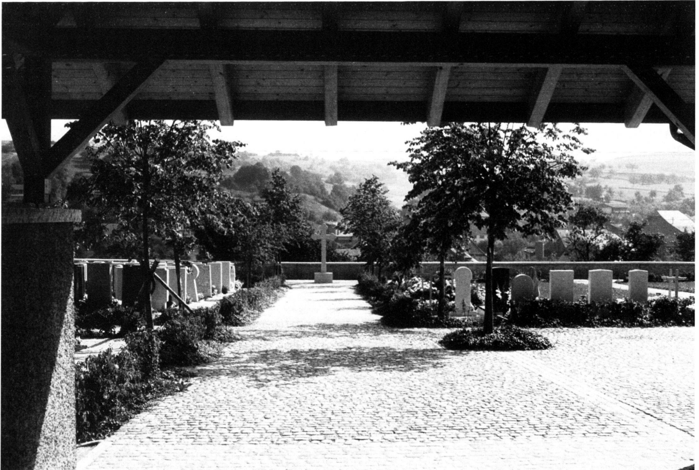
View from the cemetery building looking towards the village. From the boundary wall there is a superb view of Wölflinswil.