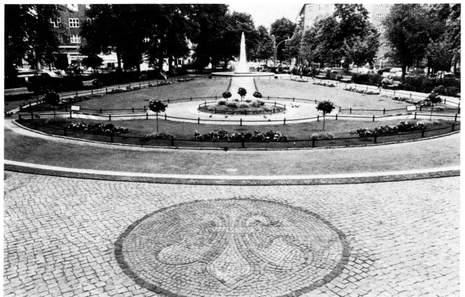
Ludwigkirchplatz, Berlin-Wilmersdorf. 1984, nach der gartendenkmalpflegerischen Wiederherstellung.

The targets being aimed at by the department of garden monument care in