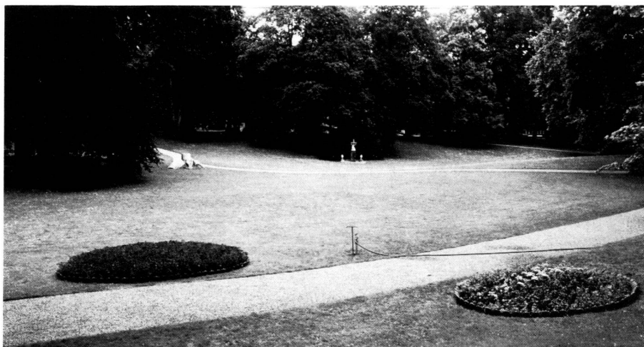
Glienicke Park, Berlin; view across the restored pleasure ground with restored beds, 1984.