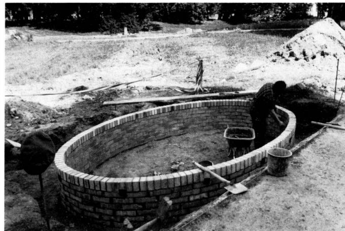
Left: Glienicke Park, Berlin; pleasure ground, flower bed at the "Kleine Neugierde" (small curiosity). State in 1980 prior to the beginning of the restoration.