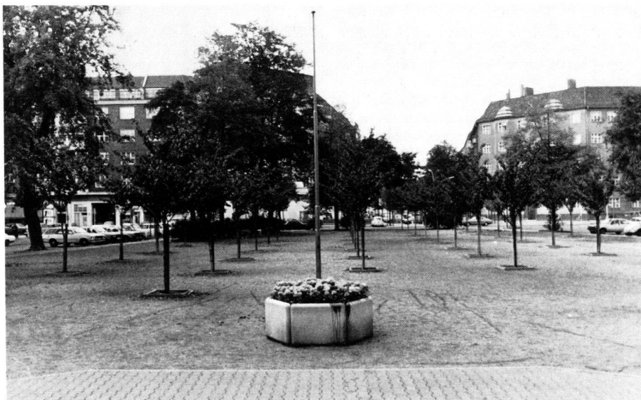
Ludwigkirchplatz, Berlin-Wilmersdorf. Zustand 1980, vor der gartendenkmalpflegerischen Wiederherstellung.