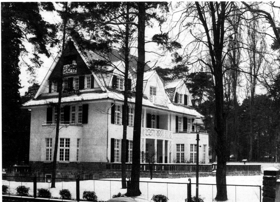
Garten Neuhaus, Bernadottestrasse, Berlin. Zustand 1979, vor der gartendenkmalpflegerischen Wiederherstellung.

An essential basis for the excavations and surveys was the plan dating from 1845, mentioned above, which proved to be extremely exact. The measurements, which only deviated for a few centimetres in parts, allowed a for the most part exact restoration of Lenné's pathway network, even ignoring the destroyed sections. Admittedly, in certain sections, a different procedure had to be adopted from that em-