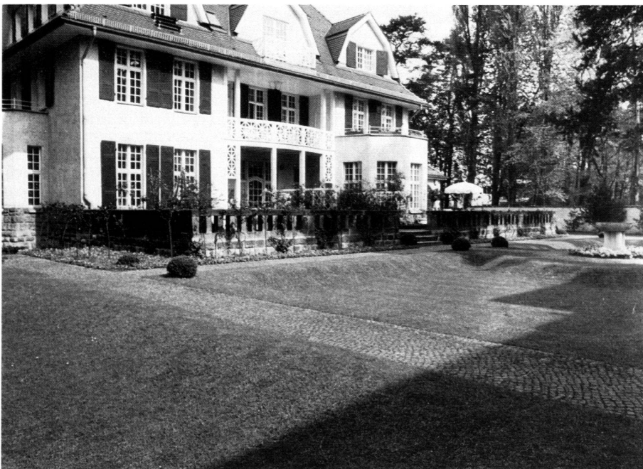
Garten Neuhaus, Bernadottestrasse, Berlin. 1983, nach der gartendenkmalpflegerischen Wiederherstellung.