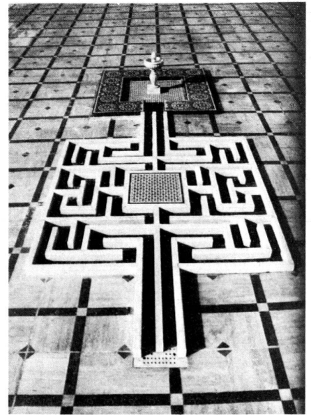
Labyrinth-Brunnen im Königspalast in Marrakesch.

Und zum Begriff der «mallems» lesen wir weiter: «Pour assurer l'authenticité de cet ouvrage, nous avons bénéficié non seulement des documents photographiques présentés, mais de la collaboration spontanée des mallems de chaque discipline artisanale. – Le malleme est «l'homme qui sait», «le Maître» comme pouvait l'être Léonard de Vinci ou Michel-Ange. Le malleme est incontesté, il règne sur sa profession. L'apprenti, ou mataalleme (celui qui apprend), le vénère.»