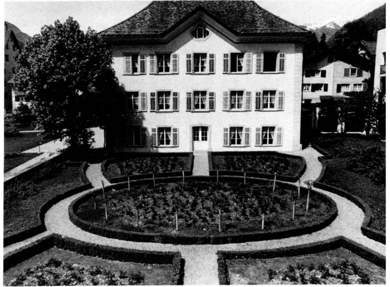
A gauche: Vue de la maison sur le jardin rococo aux formes simples et harmonieuses.

Rechts: Edel und einfach sind auch die Formen des herrschaftlichen Hauses, dem der Rokoko-Garten vorgelagert ist.