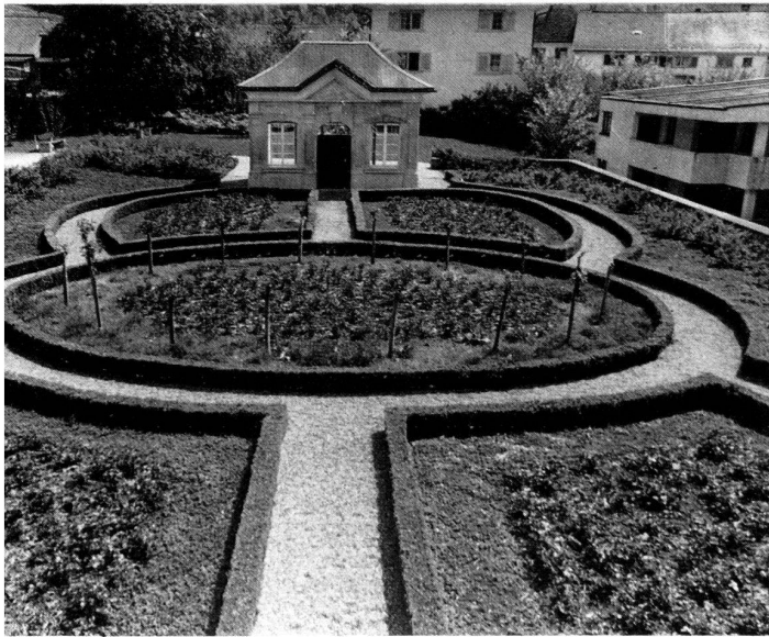
Links: Blick vom Haus auf den Rokoko-Garten in seinen einfachen ausgewogenen Formen.

Rechts: Edel und einfach sind auch die Formen des herrschaftlichen Hauses, dem der Rokoko-Garten vorgelagert ist.