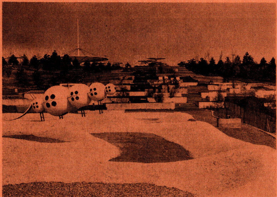
View from the playground «The Earth» to the great «Garden of Steps», designed by Erich Hanke.