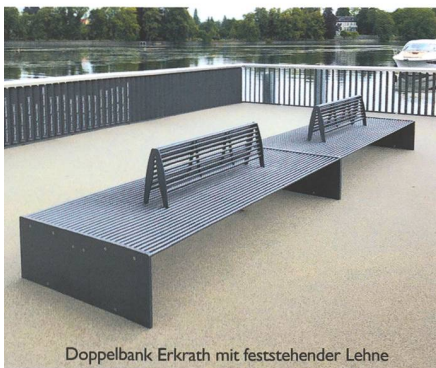
Doppelbank Erkrath mit feststehender Lehne