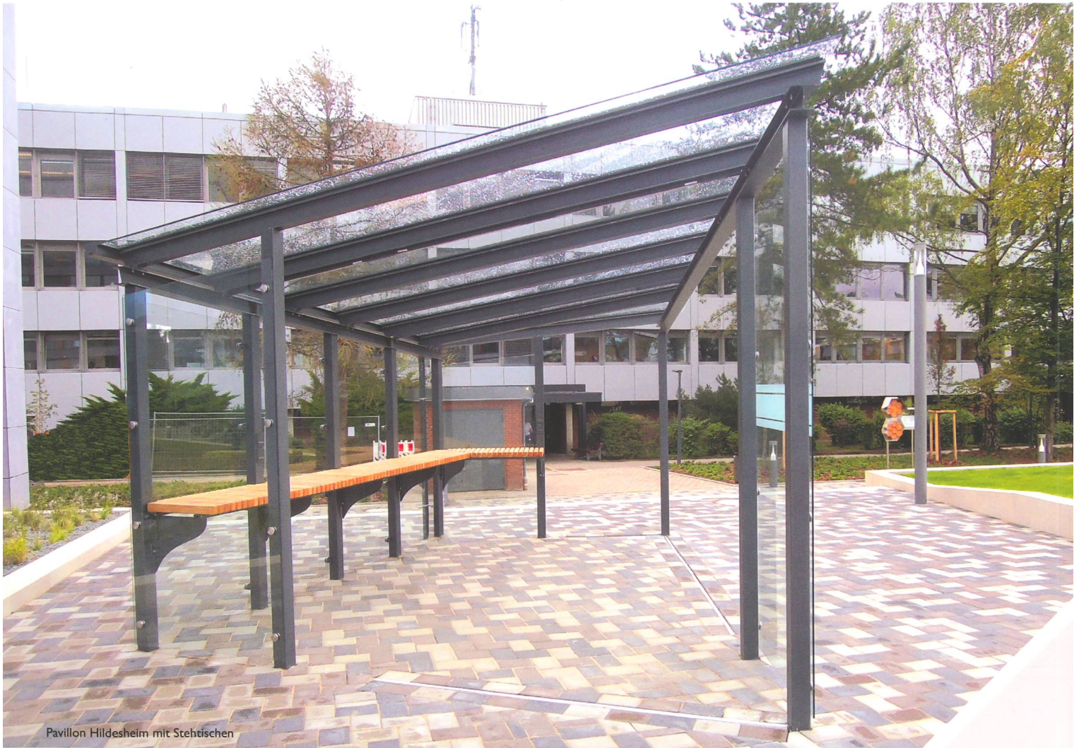
Pavillon Hildesheim mit Stehtischen

Intelligentes Stadtmobiliar: innovativ, kommunikativ, inspirierend