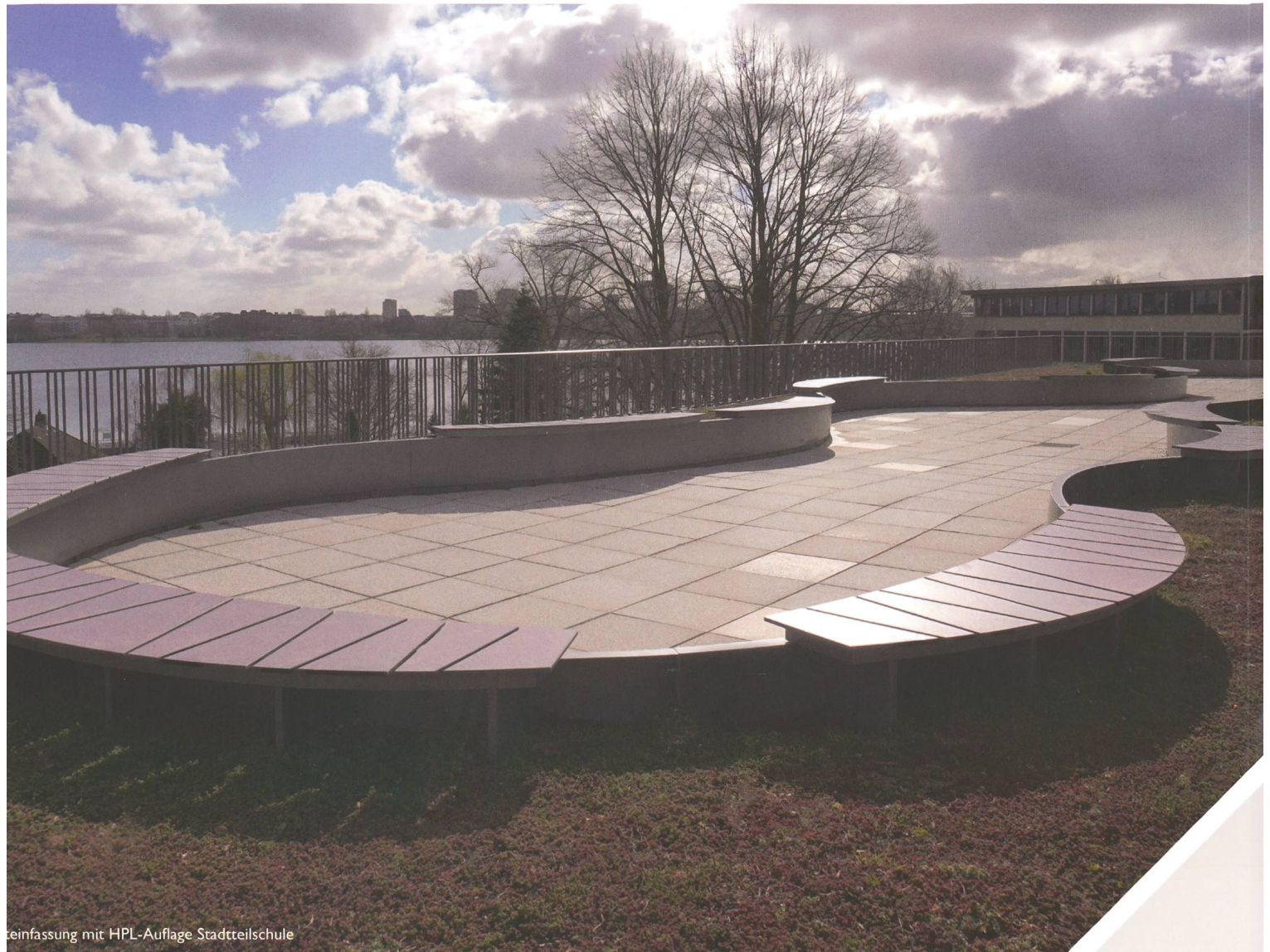
einfassung mit HPL-Auflage Stadtreilschule

elligentes Stadtmobiliar: innovativ, kommunikativ, inspirierend