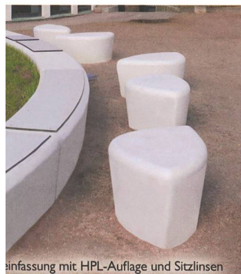
einfassung mit HPL-Auflage und Sitzlinsen