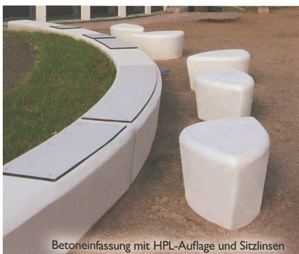
Betoneinfassung mit HPL-Auflage und Sitzlinsen