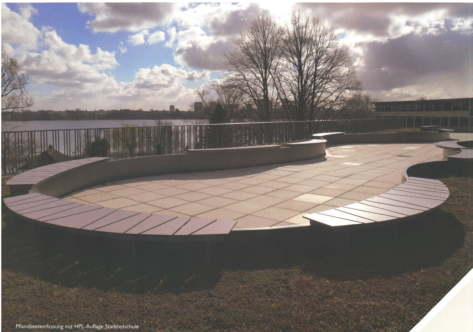
Pflanzbeeteinfassung mit HPL-Auflage Stadteilschule

Intelligentes Stadtmobiliar: innovativ, kommunikativ, inspirierend