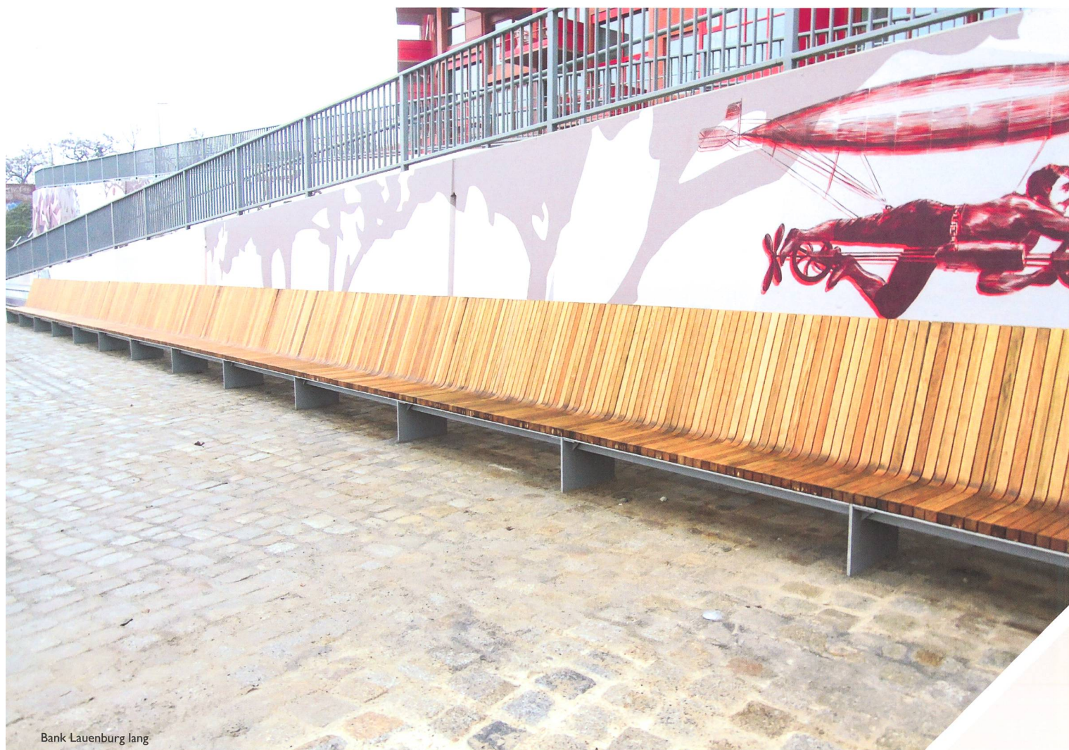
Bank Lauenburg lang

Intelligentes Stadtmobiliar: innovativ, kommunikativ, inspirierend