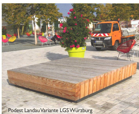
Podest Landau Variante LGS Würzburg

Bei der Gestaltung öffentlicher Räume und Parkanlagen setzen Sie mit ELANCIA immer auf den richtigen Partner. Denn mit uns an Ihrer Seite können Sie sich auf größtes Know-how von der Planung bis hin zur Realisierung verlassen. Schnell, präzise und aus einer Hand!