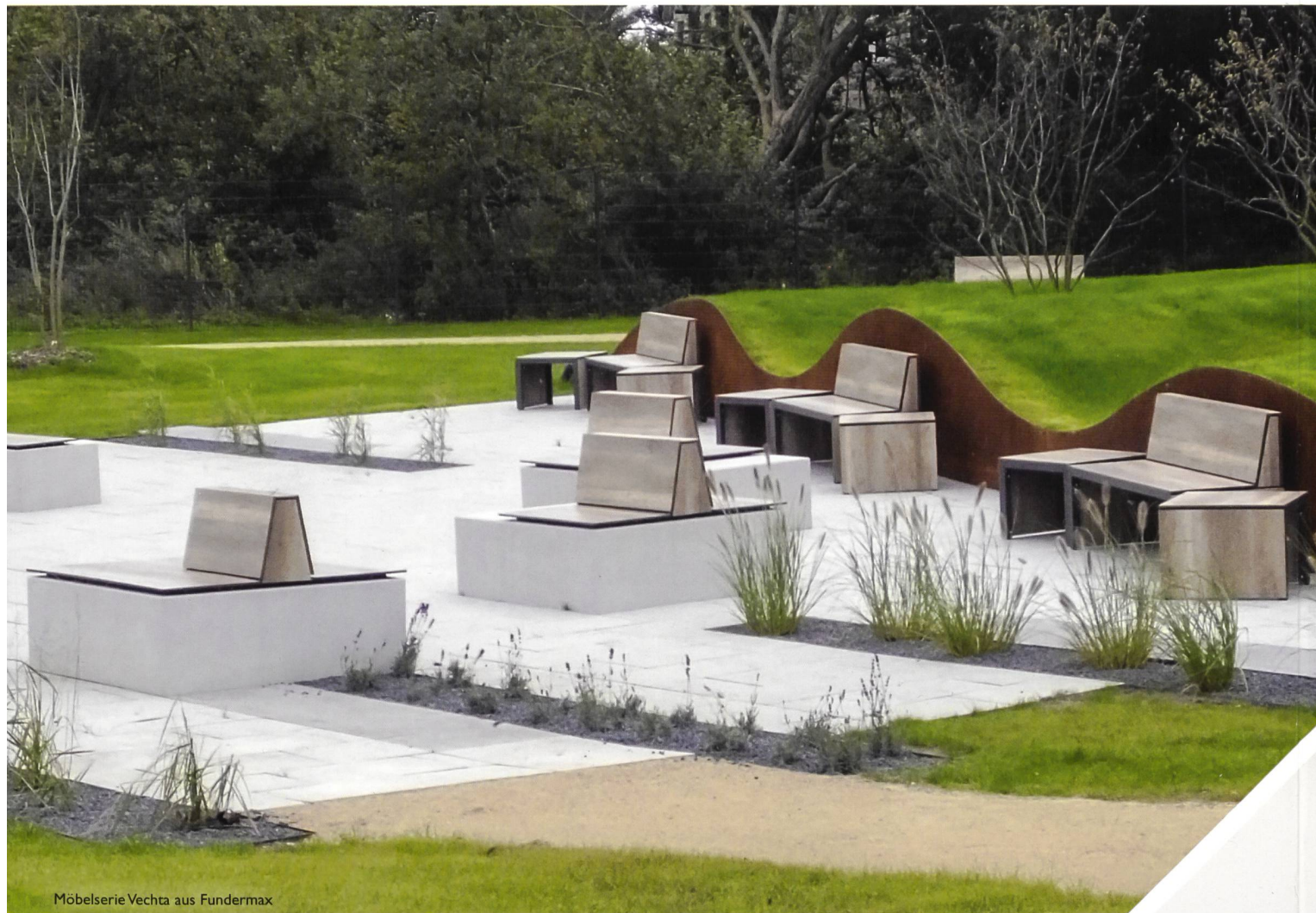
Möbelerie Vechta aus Fundermax

Intelligentes Stadtmobiliar: innovativ, kommunikativ, inspirierend