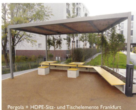
Pergola + HDPE-Sitz- und Tischelemente Frankfurt

Bei der Gestaltung öffentlicher Räume und Parkanlagen setzen Sie mit ELANCIA immer auf den richtigen Partner. Denn mit uns an Ihrer Seite können Sie sich auf größtes Know-how von der Planung bis hin zur Realisierung verlassen. Schnell, präzise und aus einer Hand!