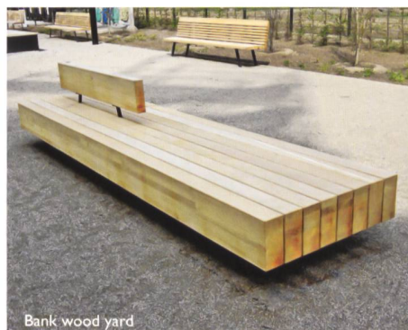
Bank wood yard

Bei der Gestaltung öffentlicher Räume und Parkanlagen setzen Sie mit ELANCIA immer auf den richtigen Partner. Denn mit uns an Ihrer Seite können Sie sich auf größtes Know-how von der Planung bis hin zur Realisierung verlassen. Schnell, präzise und aus einer Hand!