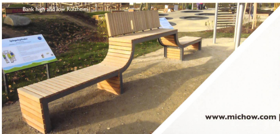
Bank high and low Rülzheim

Bei der Gestaltung öffentlicher Räume und Parkanlagen setzen Sie mit ELANCIA immer auf den richtigen Partner. Denn mit uns an Ihrer Seite können Sie sich auf größtes Know-how von der Planung bis hin zur Realisierung verlassen. Schnell, präzise und aus einer Hand!