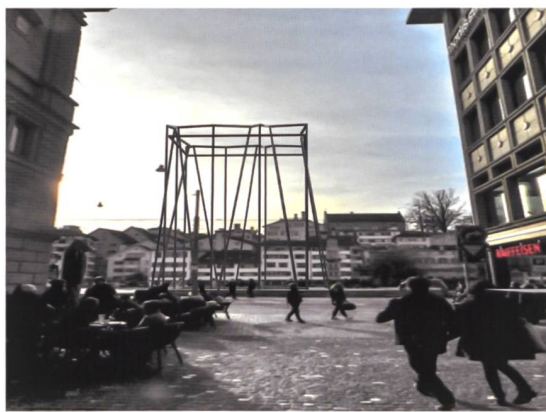
Skulptur «Organisation der Leere» am Limmatquai in Zürich. Projekt aus dem Jahr 2005.