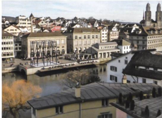
«Organisation der Leere» sur le Limmatquai à Zurich. Projet de 2005.