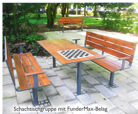
Schachtischgruppe mit FunderMax-Belag