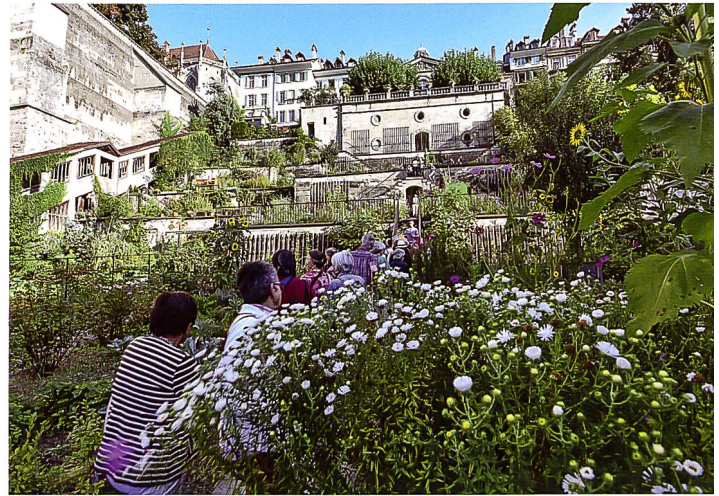
Boris Schibler; NIKE

werden, die Freiräume aller Art als zentrale Aspekte der Siedlungsentwicklung erkennen.