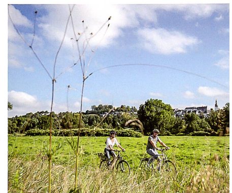
Ruhrgebiet Tourismus GmbH (4)

sind die Ruhr Tourismus GmbH, der Sauerland Tourismus e.V., der Regionalverband Ruhr und der Hochsauerlandkreis. Darüber hinaus beteiligen sich 23 Kommunen und weitere 4 Landkreise als öffentliche Kooperationspartner am RuhrtalRadweg. Diese Partner stellen auf Basis einer Umlagefinanzierung, die sich aus dem Kilometeranteil am RuhrtalRadweg und den touristischen Übernachtungszahlen errechnet, circa 80 000 Euro pro Jahr für den RuhrtalRadweg bereit. Die entsprechenden Kooperationsvereinbarungen werden in der Regel für einen Zeitraum von fünf Jahren abgeschlossen.