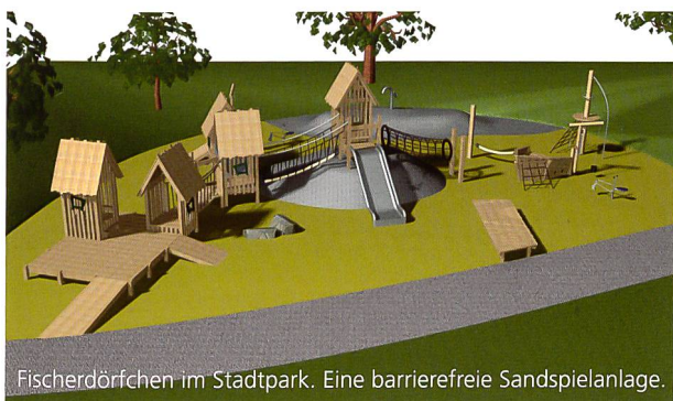
Fischerdörfchen im Stadtpark. Eine barrierefreie Sandspielanlage.