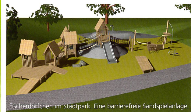
Fischerdörfchen im Stadtpark. Eine barrierefreie Sandspielanlage.