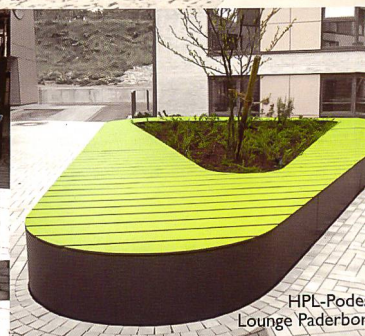
HPL-Pode: Lounge Paderbor

Bei der Gestaltung öffentlicher Räume und Parkanlagen setzen Sie mit ELANCIA immer auf den richtigen Partner. Denn mit uns an Ihrer Seite können Sie sich auf größtes Know-how von der Planung bis hin zur Realisierung verlassen. Schnell, präzise und aus einer Hand!