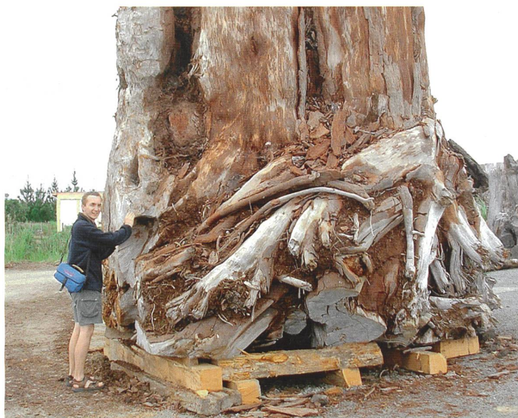
4 Jonathan Palmer, University of New South Wales

The key findings of the Synthesis Report (published november 2014) are: Human influence on the climate system is clear; The more we disrupt our climate, the more we risk severe, pervasive and irreversible impacts; We have the means to limit climate change and build a more prosperous, sustainable future. The release includes the fully laid-out Summary for Policymakers of the Synthesis Report and the longer report comprised of an Introduction and four topics, plus six annexes (about 110 pages). The IPCC has also released on the website drafts of the Synthesis Report, and comments arising from the expert and government review. www.ipcc.ch/report/ar5/syr