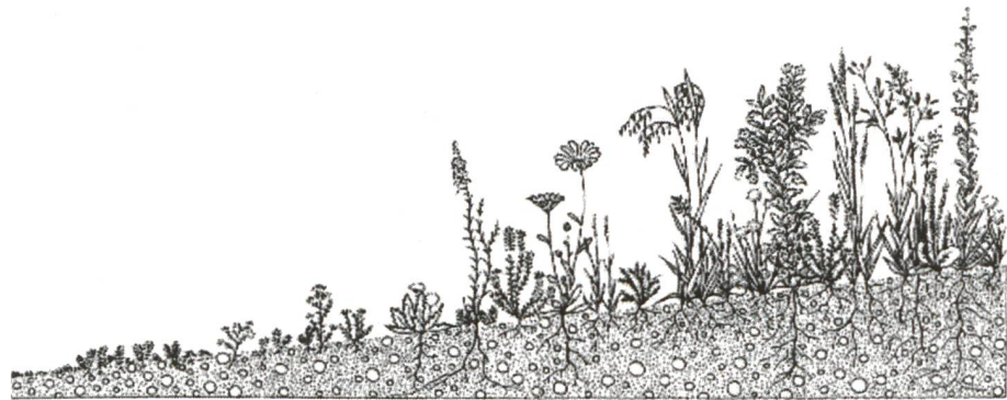
Auszug aus der Norm SIA 312 © SIA Zürich (2)

2 Intensivbegrünung: Vegetationstypen in Abhängigkeit von der Substratschicht (12 bis 50 Zentimeter: Rasen, Stauden und Kleinsträucher, Stauden und Grosssträucher). Végétalisation intensive: Les types de végétaux en fonction de la couche de substrat (12 à 50 centimètres: gazon, prairie, plantes herbacées, arbustes à faible développement, plantes ligneuses à grand développement).