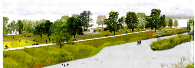
Auenlandschaft in Lörrach-Tumringen Paysage de zone alluviale à Lörrach-Tumringen