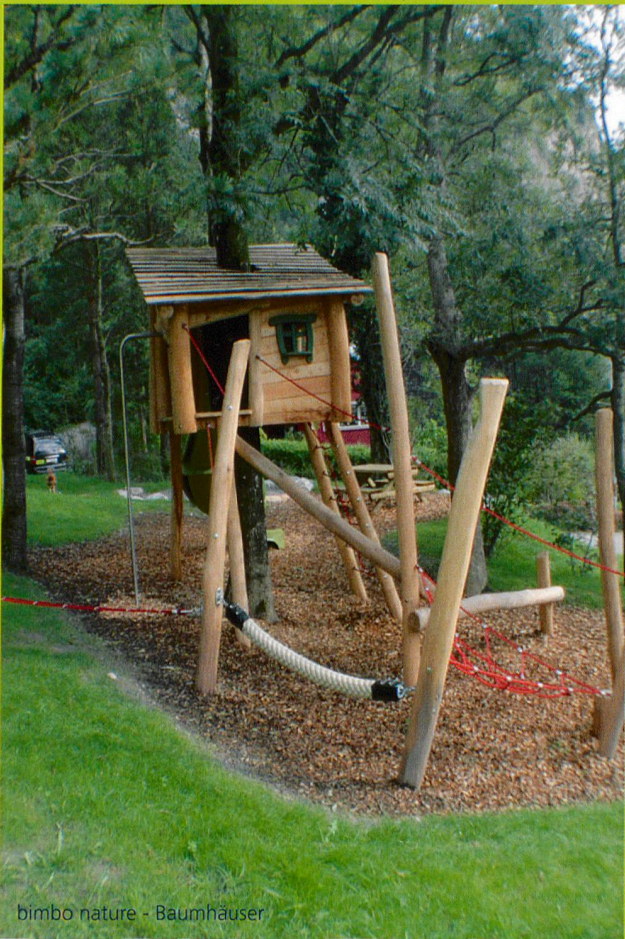
bimbo nature - Baumhäuser