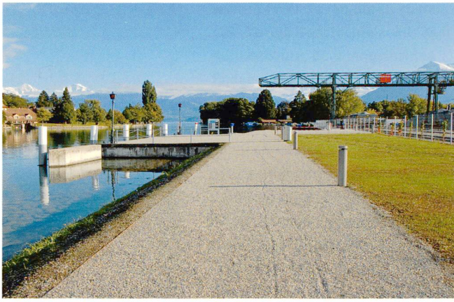
Einer der ATU Preise 2012 geht an den Uferweg Bahnhof-Schadau in Thun.

souligne la continuité de l'espace tout en réagissant localement aux variations de la pente du site et en connectant les multiples relations transversales existantes. Un élément de base en béton préfabriqué est décliné en fonction des situations variées. La perception du paysage reste différenciée au cours du parcours sur cette infrastructure nouvelle inscrite dans le terrain. Le boisement qui accompagne la promenade varie selon le caractère du tronçon. Appréciant l'espace comme unité territoriale, le projet prend en même temps la mesure de la densification des quartiers adjacents: il montre son insertion dans la situation actuelle et dans la situation future. Le projet arrive à urbaniser discrètement ce morceau de paysage et renforce cette entité, que l'on peut comparer à l'échelle du territoire genevois à la Rade ou à l'aire de l'aéroport. Il rendra accessibles des espaces de détente dans une nature urbaine. En même temps il a la force d'absorber les flux de piétons et cyclistes qui, avec l'arrivée de la gare CEVA de