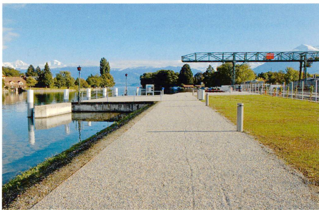
Einer der ATU Preise 2012 geht an den Uferweg Bahnhof-Schadau in Thun.

souligne la continuité de l'espace tout en réagissant localement aux variations de la pente du site et en connectant les multiples relations transversales existantes. Un élément de base en béton préfabriqué est décliné en fonction des situations variées. La perception du paysage reste différenciée au cours du parcours sur cette infrastructure nouvelle inscrite dans le terrain. Le boisement qui accompagne la promenade varie selon le caractère du tronçon. Appréciant l'espace comme unité territoriale, le projet prend en même temps la mesure de la densification des quartiers adjacents: il montre son insertion dans la situation actuelle et dans la situation future. Le projet arrive à urbaniser discrètement ce morceau de paysage et renforce cette entité, que l'on peut comparer à l'échelle du territoire genevois à la Rade ou à l'aire de l'aéroport. Il rendra accessibles des espaces de détente dans une nature urbaine. En même temps il a la force d'absorber les flux de piétons et cyclistes qui, avec l'arrivée de la gare CEVA de