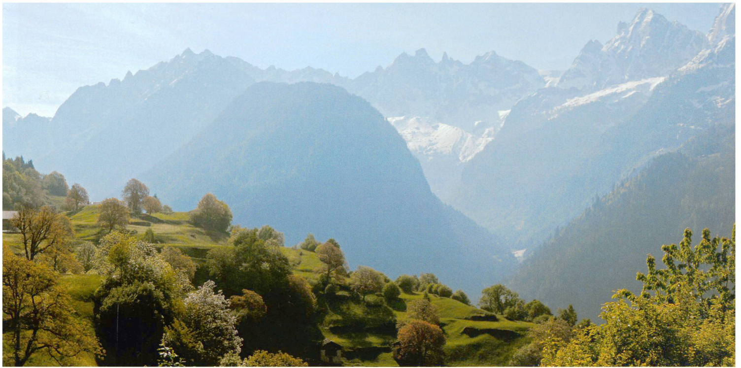
Tilman Gottesleben (2)