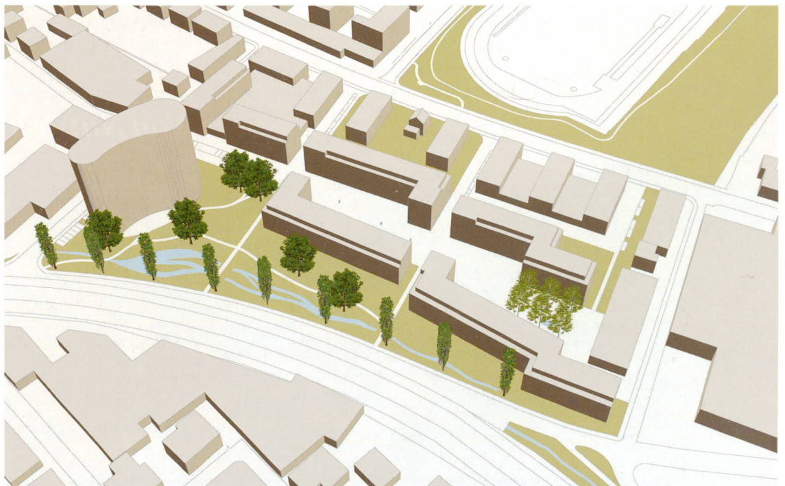
Der von der Gemeinde Wil gewählte Vorschlag für das Integra-Areal, erarbeitet von P. + J. Diethelm Architekten mit Tschumi Landschaftsarchitektur.

Die Hintermann & Weber AG schreibt für 2012 erneut den Forschungspreis für Natur- und Landschaftsschutz aus. Prämiert wird eine herausragende, originelle oder besonders praxisrelevante wissenschaftliche Leistung, die für den Natur- und Landschaftsschutz in Mitteleuropa von Bedeutung ist. Die Arbeit soll entweder: eine Lösung für ein Problem im Natur- oder Landschaftsschutz aufzeigen; ein bisher kaum erkanntes Problem erkennen; neue Wege für den Natur- oder Landschaftsschutz aufweisen; bestehende Strategien neu bewerten oder wesentlich zur Prioritätenbildung beitragen. Der wissenschaftliche Nachwuchs, insbesondere abgeschlossene Diplom- und Doktorarbeiten, sollen ausgezeichnet werden (Forschungspreis). Die Bewerbungsfrist läuft bis zum 15. August 2012. Weitere Informationen unter: www.hintermannweber.ch