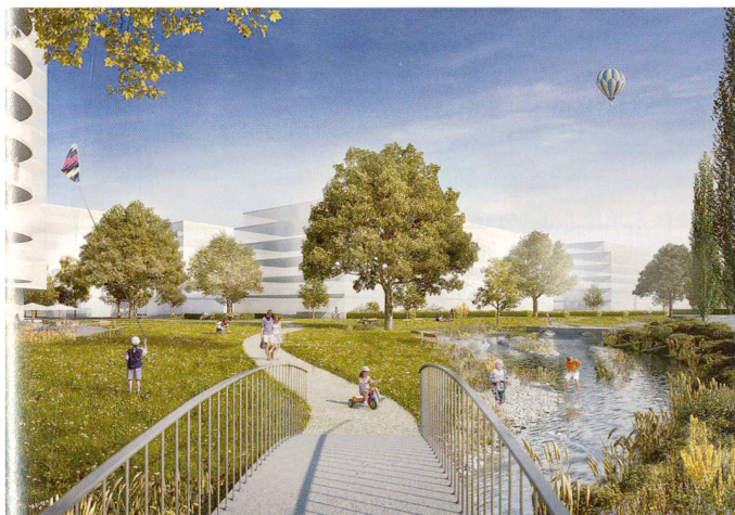
Der von der Gemeinde Wil gewählte Vorschlag für das Integra-Areal, erarbeitet von P. + J. Diethelm Architekten mit Tschumi Landschaftsarchitektur.

Das Wasser bringt die Natur unvermittelt in den urbanen Kontext von Strassen, Bahn und Häusern. Der angrenzende Park lädt zum Spielen und Verweilen ein. Im Stile des englischen Landschaftsgartens ist er offen gestaltet, mit einzelnen, schattenspendenden Parkbäumen und mäandrierenden Wegen. Dem Hochhaus vorgelagert ist eine öffentliche Terrasse. Im Bereich der Wohnbauten stossen Privatgärten an den Park, wodurch sich das öffentliche Grün im Privaten fortsetzt. Die Grosszügigkeit des umgebenden Freiraums weicht hier der Kleinteiligkeit individueller Nutzungen; die Gärten sind durch Hecken begrenzt. Die Bebauung und die Strasse mit angrenzendem Bahntrasse werden von einer Pappelreihe locker getrennt. Die