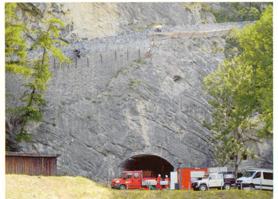
Cornel Doswald, ViaStoria (2)