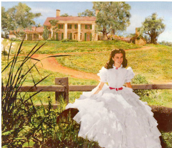
5 Filmstill; Victor Fleming, USA 1939

Kulturell hybride Erinnerungslandschaften haben sich in Südamerika entwickelt. Im 17. und 18. Jahrhundert gründeten Jesuiten auf dem Gebiet von Paraguay, Bolivien und Südbrasilien sogenannte Reduktionen (von spanisch reducir = zusammenführen), in denen die nomadischen Indianer in festen Siedlungen zusammengeführt wurden. Das Ziel war, die Indigenen zu christianisieren, vor der Ausbeutung zu schützen und zu «zivilisierten Wesen» zu entwickeln. Die Folge war eine grundlegende Umgestaltung des als «Naturlandschaft» bewerteten Gebietes 3 in eine mit befestigten Siedlungen durchsetzte, nach europäischen Konzepten strukturierte Kulturlandschaft.