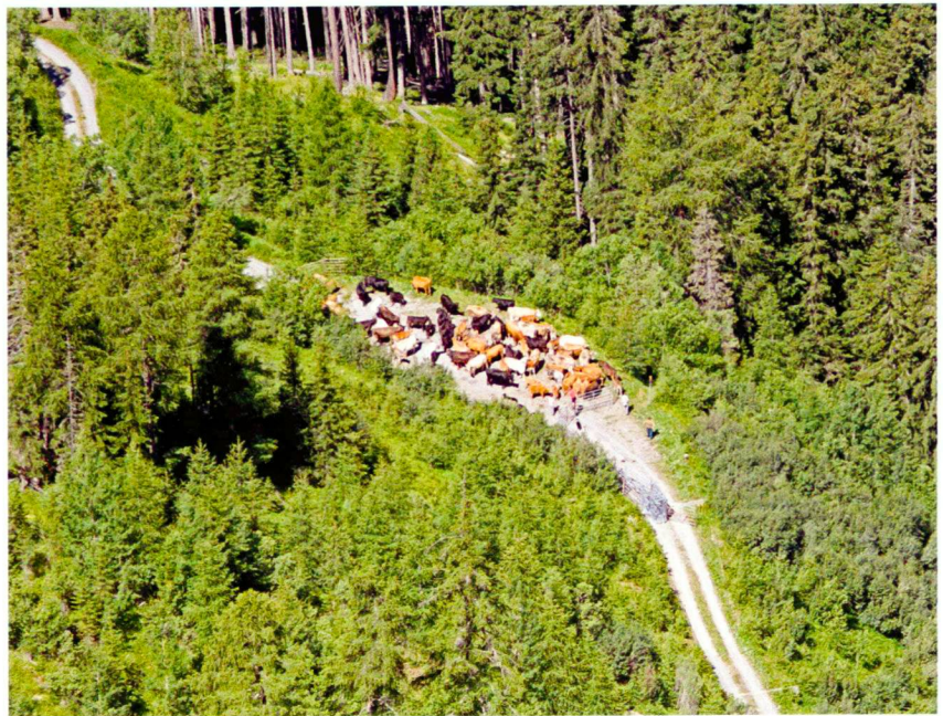
Ulrich Wasem (2)

Die wichtigste Herausforderung für die Planung und die Umsetzung von Naturschutzmassnahmen besteht darin, dass an dem lange verfolgten Konzept der Repräsentation von Biodiversitätselementen und -mustern an einem bestimmten Ort nicht festgehalten werden kann. Solche adaptiven Naturschutzkonzepte müssen die Anpassung der Natur an die Folgen des Klimawandels grenzübergreifend unterstützen. Entsprechend wichtig ist es daher, die flächenschutzrelevanten Politiken wie Planung und Zonierung, Verkehr oder Energie auch unter dem Gesichtspunkt des Klimawandels zu beleuchten und bei anstehenden Gesetzesrevisionen diesen Aspekten ein besonderes Augenmerk zu schenken. Eine erste Gelegenheit dazu ergibt sich im in Revision begriffenen Raumplanungsgesetz, welches noch dieses Jahr in die Vernehmlassung geht.