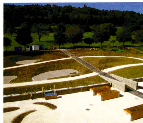
Reha Clinic Bad Zurzach