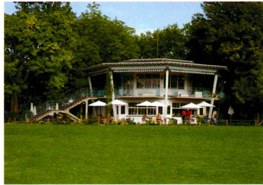
Schopp / Wolf (2)

pflanzt, das Zierbecken beim Restaurant, die Natursteinmauern und die Steinplattenwege wieder hergestellt. Lockere Baum- und Strauchgruppen, geschwungene, mit Naturstein gesäumte Wege und prächtige Staudenpflanzen prägen heute erneut das Bild der Anlage.