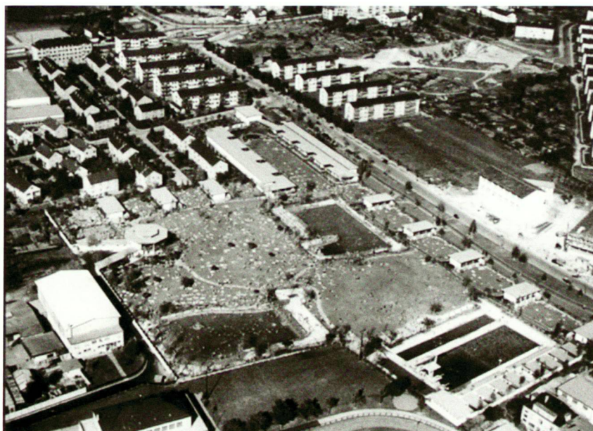
Photo aérienne de 1949.