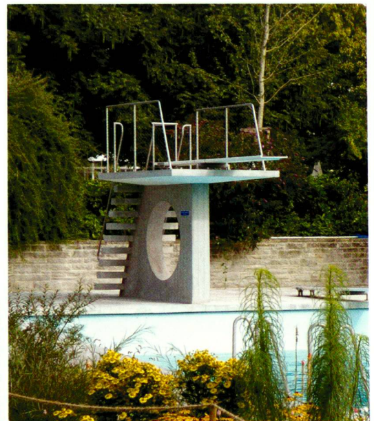
Craven / Maf