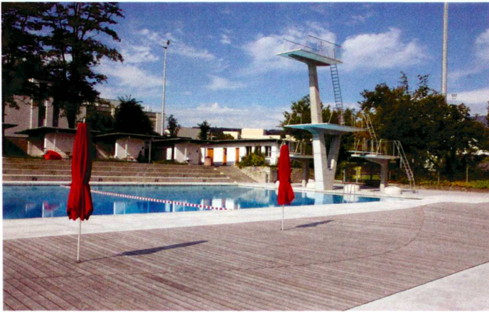
Schopp / Wolf (4)