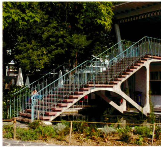
Freitreppe und Pavillon 1949 und 2007 nach aufwändiger Sanierung und Rekonstruktion der ursprünglichen Be- pflanzung.

Escalier extérieur et pavillon en 1949 et 2007, après un assainissement onéreux et la reconstruction de la plantation originelle.