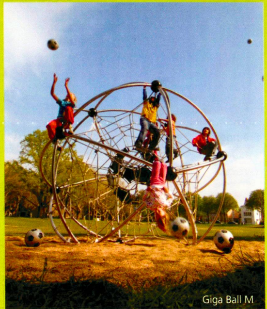
Giga Ball M