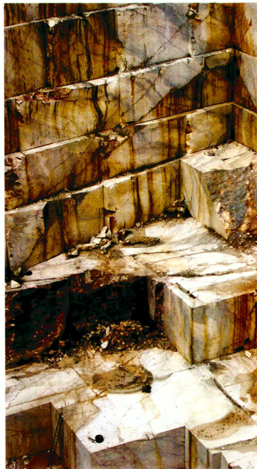
Hanspeter Burkart (4)