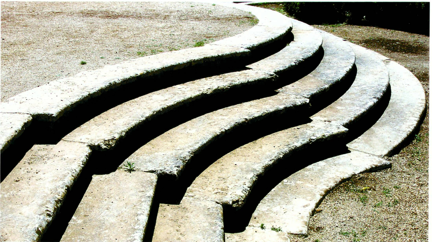
Queluz: Jardim do Palácio de Queluz, Marmortreppe im abgesenkten Maltesergarten (18. Jh.).

Lisbonne: Rossio, place au centre de la vieille ville avec ses pavés en forme d'ondulations (19 e siècle).