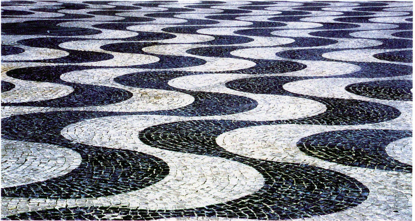
Lissabon: Rossio, Platz im Zentrum der Altstadt mit wellenförmiger Pflästerung (19. Jh.).

Hanspeter Burkart, architecte, Rapperswil