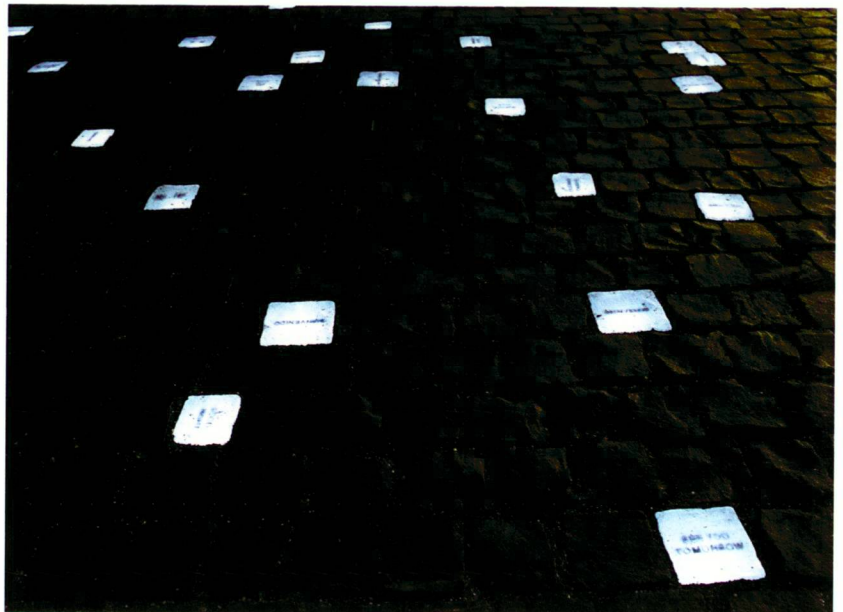
Ville de Genève

wird der grau-schwarze Bodenbelag nachts gleichsam zum Hintergrund eines weiss leuchtenden Milchstrassenausschnittes, welcher den Blick zur kontinuierlich fliessenden Rhone leitet. Die Aussage dieses lokalen Pendants zur Weite des Alls wird durch in die würfelförmigen Elemente eingravierte und weltweit verstandene Mitteilungen betont: in den sechs offiziellen UNO-Sprachen steht dort «guten Tag», «gute Nacht» oder «herzlich willkommen».