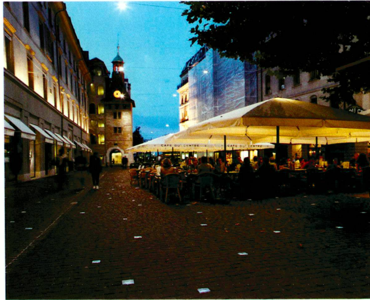
Ville de Genève