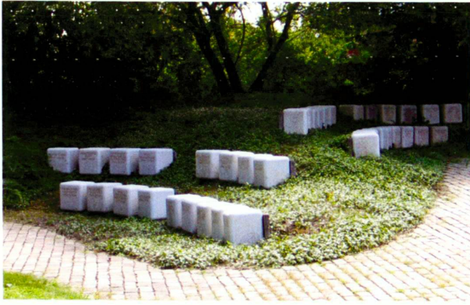
Gabi Lerch, 2005 (2)