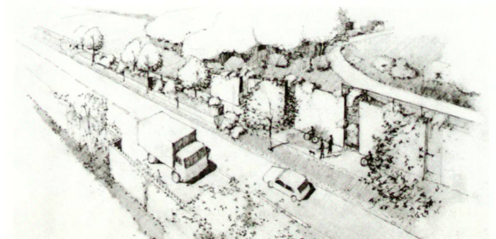
Die Umfahrungsstrasse Döttingen-Klingnau um 1978/80 wird von begrünten Lärmschutzwänden flankiert. Steinkorbelemente rhythmisieren die bergseitige Mauer. Zeichnung: Albert Zulauf.