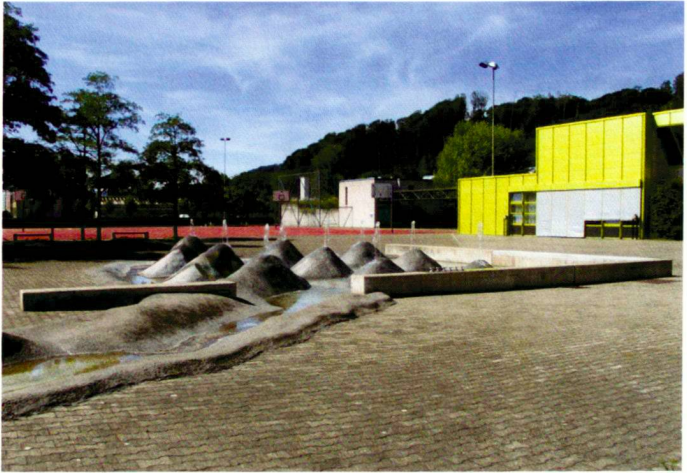
Im Oberstufenzentrum in Nussbaumen um 1990 kontrastieren organisch-spielerische Formen mit der geometrischen Grundstruktur; die Brunnenidee stammt von Sohn Rainer.