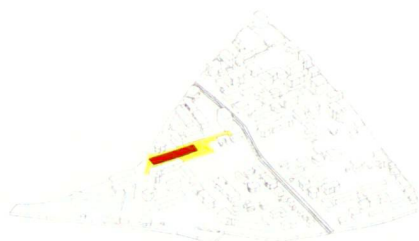
eins – der Stadtpol wird entwickelt – er wird zum Anziehungspunkt

Le nouveau centre urbain («Stadtpol») comme point de départ pour le réaménagement de Kloten.