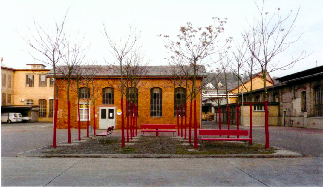
Rotzler Krebs Partner