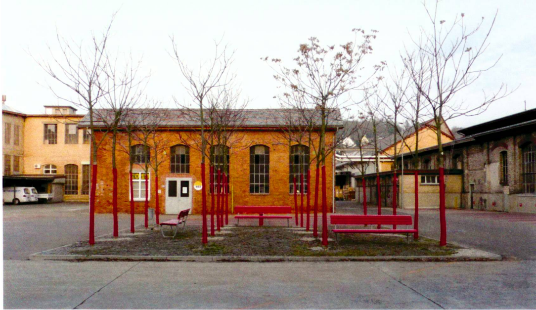
Rotzler Krebs Partner