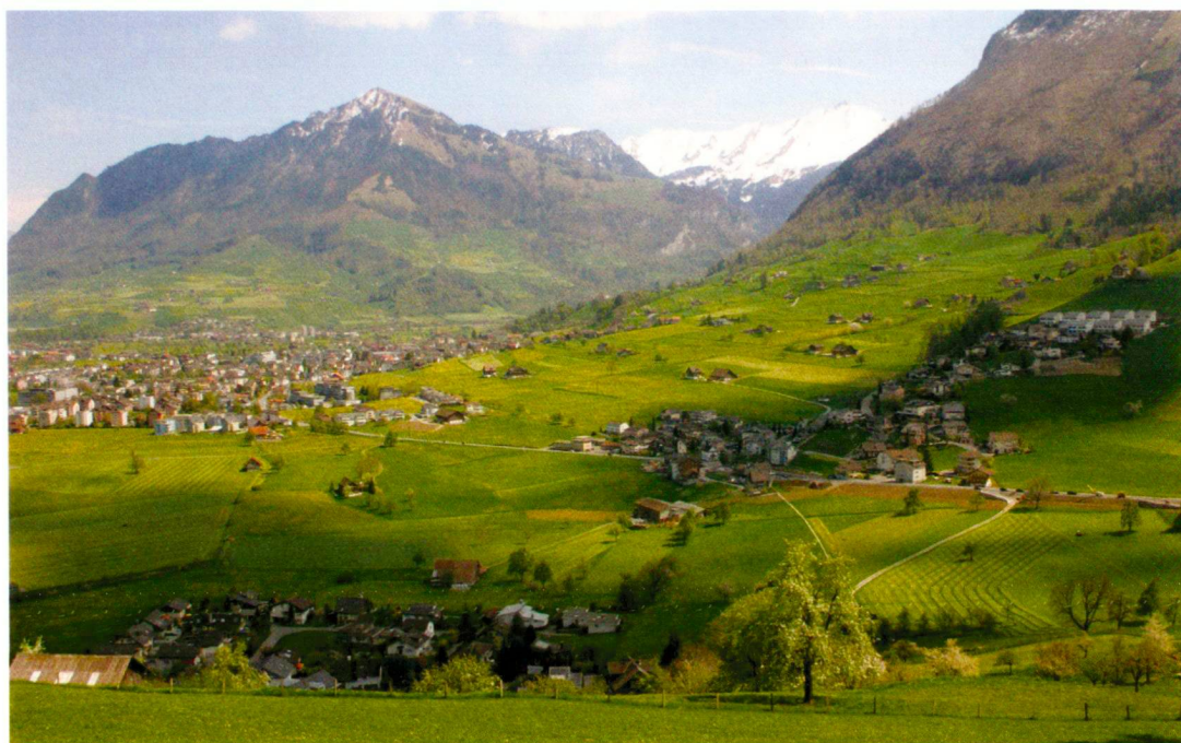
Landwirtschaftlicher Informationsdienst (2)

La pression d'urbanisation sur les zones agricoles reste importante.