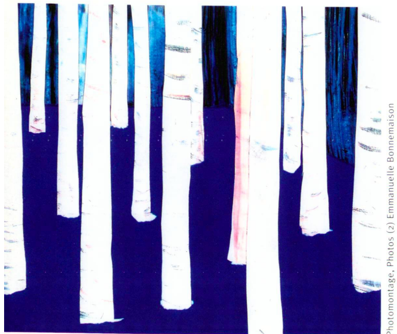
Photomontage, Photos (2) Emmanuelle Bonnemaïson