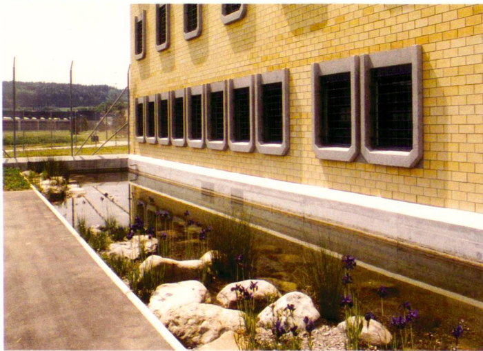
Abstandswassergraben zur Fassade (links), Freiraum für Sucht- und psychisch Kranke (rechts).

Fossé d'eau empêchant l'accès à la façade (à gauche), aménagements extérieurs pour personnes dépendantes et malades psychiques (à droite).