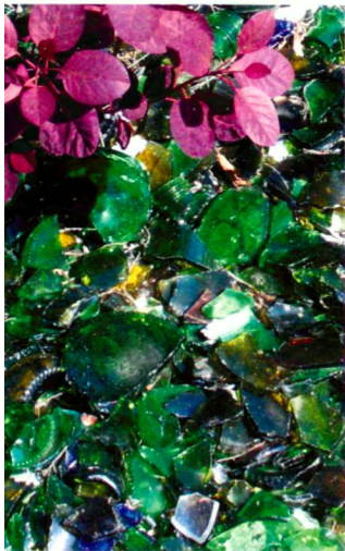
Pflanztröge aus glasfaser- verstärktem Kunststoff, abgedeckt mit einer Schicht aus gebrochenem Glas.

Des bacs à plantes en plastique renforcé de fibres de verre, recouverts d'une couche de verre concassé.