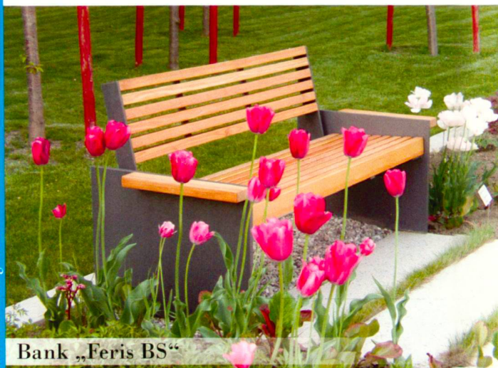
Bank „Feris BS“