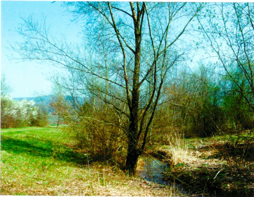
Verlegung Dorfbach Spreitenbach: Muster für naturnahen Aargauer Wasserbau. Metron Orts- und Regionalplanung, Windisch.

Déplacement du ruisseau Spreitenbach: un exemple pour des constructions hydrauliques proches de la nature. Metron Orts- und Regionalplanung, Windisch.