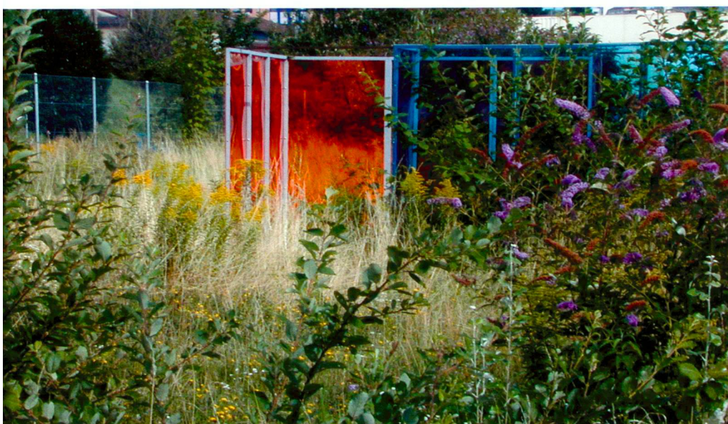
Arc et Senans