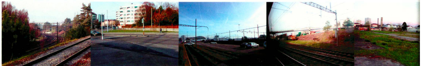
Il était une voie dans l'Ouest Triporteur/Au 301/tinera