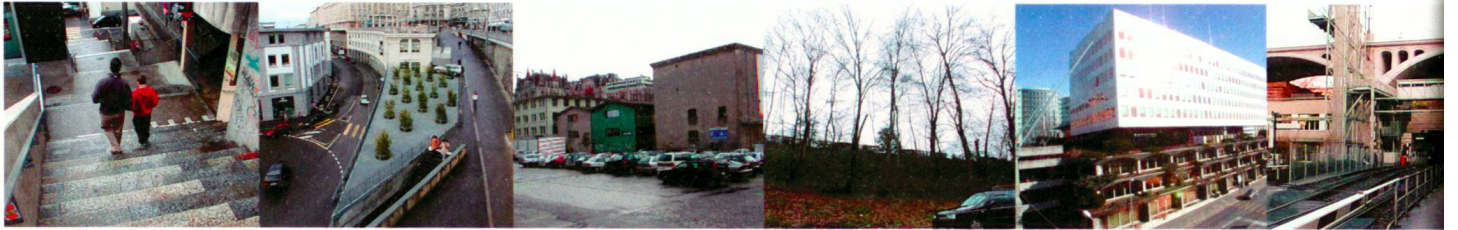
Escaliers de Bel-Air Hüsler/Amphoux