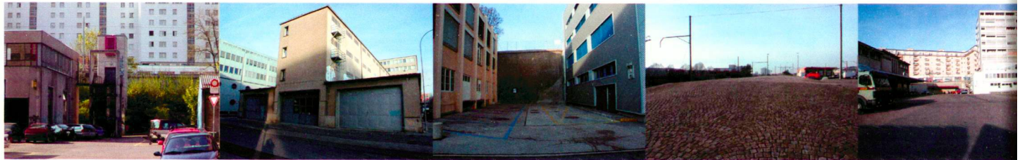
Palmiers du monde Perlingeiro/3BM3/Stefani et collaborateurs