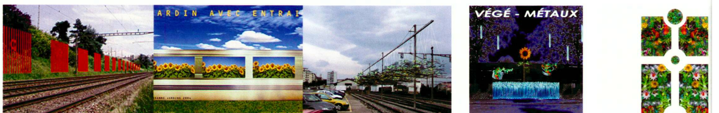
Le Migradis Beyeler/Merz/Gaissert