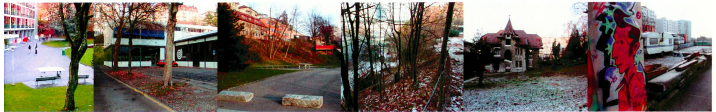
sur le tapis Schmidhofer Fleur de pavés L'atelier du paysage / Jean-Yves Le Baron Vibrations Bureauparis/Leroy L'escalier d'eau Folkerts/Spax architecten Dans de beaux draps HES Lullier (Graber/Lintz) Les coureuses Squash cake Bureau