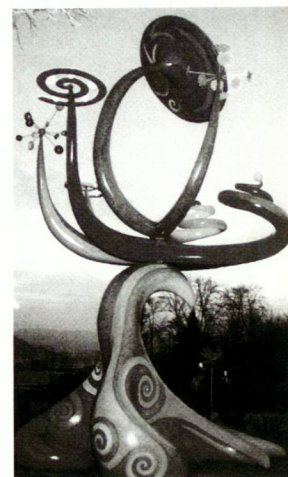
Gross-Skulptur «Solara Spiratica» von Claire Ochsner

Jusqu'au 19 octobre 2003, Chaumont-sur-Loire F Festival international des jardins Le 12 e festival international des jardins propose de creuser les effets botaniques et esthétiques