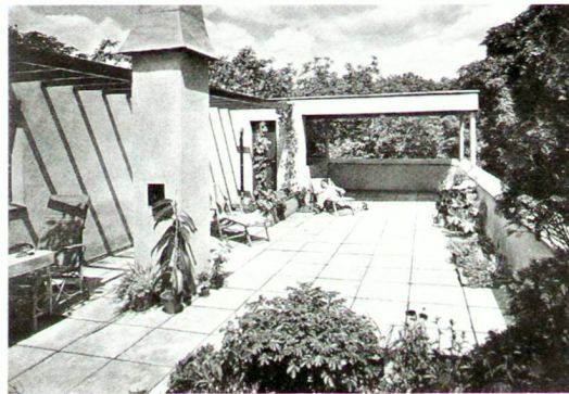
Dachgarten im Bauhausstil, 20er-Jahre

D ans l'architecture traditionnelle de l'ère préindustrielle, les toits dénotaient une forte appartenance régionale. Leur forme dépendait du climat, de la fonction spécifique de l'édifice, ainsi que du matériau de construction à disposition. Certains toits sont typiques d'un paysage, d'autres ensembles de toits constituent un