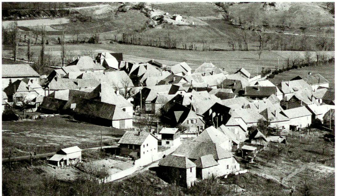
Dachlandschaften von Siena und eines Alpendorfes

Les «paysages de toits» de Sienne et d'un village alpin