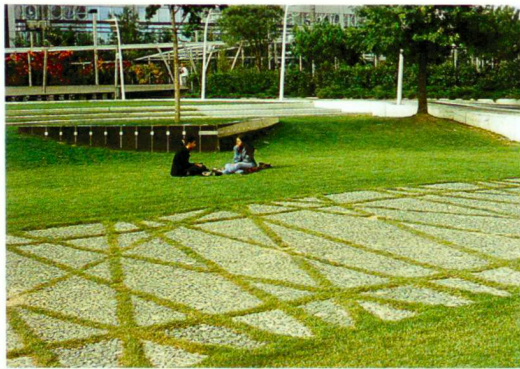
Dachgestaltung des Palais Omnisport in Paris, Michel Andrault/Pierre Parat/Jean Prouvé, 1983