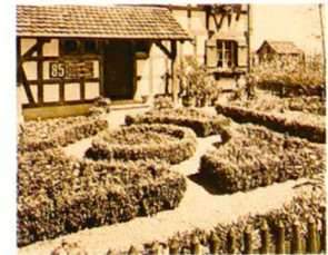
Landi 1939: Anlage von Gustav Ammann; Garten im Landidörfli von J. Schweizer

Exposition nationale 1939 (Landi): aménagement par Gustav Ammann; Le jardin dans le «Village suisse» (J. Schweizer)