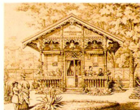
1. Schweiz. Landesausstellung in Zürich 1883: Parkanlagen auf dem Platzspitz; Pavillons im Park

Première exposition suisse de jardin à Zurich 1883: l'aménagement du parc sur la Platzspitz; Les Pavillons dans le parc