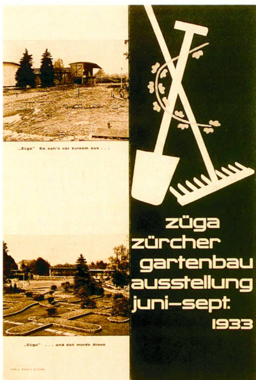
Züga 1933, Prospekt

Les expositions de jardin autonomes sont issues des foires industrielles et artisanales, des expositions universelles et nationales du 19ème siècle. Si leur point fort était à l'origine la défense d'intérêts commerciaux, il réside de plus en plus aujourd'hui dans des exigences conceptuelles et artistiques.