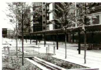
La corbeille souterraine à l'aéroport de Stuttgart Unterflur auf dem Flughafen Stuttgart The IFF Sub-surface Tree Grate at Stuttgart Airport