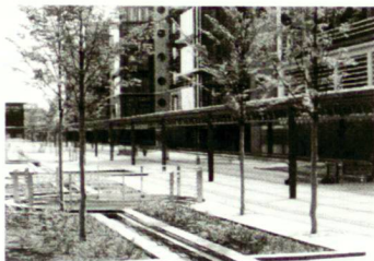
La corbeille souterraine à l'aéroport de Stuttgart Unterflur auf dem Flughafen Stuttgart The IFF Sub-surface Tree Grate at Stuttgart Airport